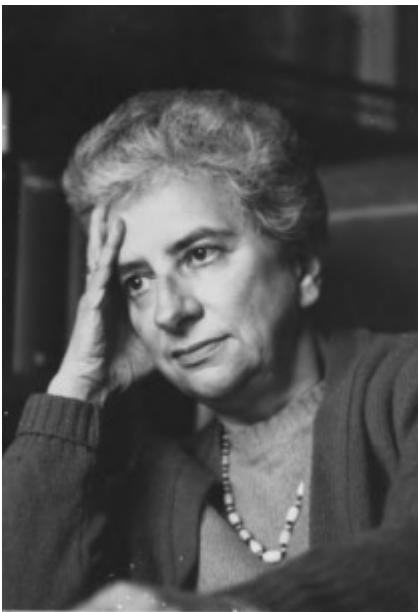
La poetessa Margherita Guidacci (25 aprile 1921 – 19 giugno 1992)