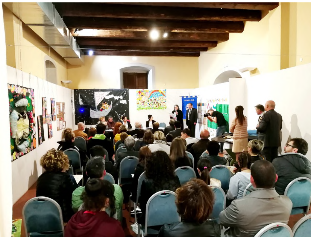
Panoramica nella Sala di Villa Pecori Giraldi durante la cerimonia di premiazione del Concorso "Margherita Guidacci"

Sabato 11 maggio 2019 a Villa Pecori Giraldi a Borgo San Lorenzo nell'ambito della manifestazione "Mugello da Fiaba", si è svolta nella Sala delle Conferenze, la premiazione del Premio Biennale di Poesia "Margherita Guidacci", dedicato alla memoria dell'Ing. Arch. Paolo Collini, presidente del Rotary Club Mugello nel 1996/1997, che sotto il suo rettorato ideò ed organizzò questo concorso letterario in onore della grande poetessa mugellana, dedicato agli allievi della Scuola Secondaria di Primo Grado e della Scuola Primaria.