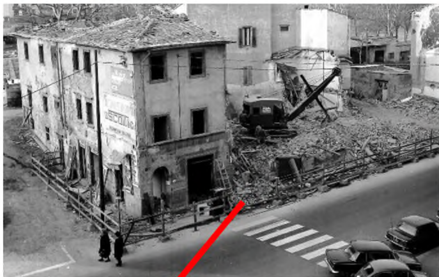
1970 - Demolizione di case in via Villamagna per la costruzione del ponte sull'Arno